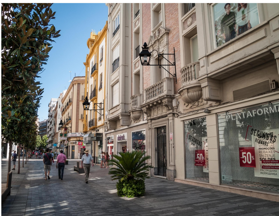
Recreación de cómo quedaría nuestro farol identitario , modelo Córdoba en la calle Cruz Conde. Solución ideal.

hacia el suelo de estas calles más anchas y colocándole los cristales rugosos, que evitaría el reflejo de la parrilla LED´s en unos cristales transparentes. Nota: la solución de retirar la tulipa sólo la veríamos adecuada para el Centro Histórico Comercial, pero nunca para el Casco Histórico , donde su visión con tulipa es consustancial a la imagen prototípica de nuestro Casco Histórico. Por eso, hay que diferenciar Casco y Centro Histórico y adoptar soluciones distintas, pues distinta es la morfología de las calles que componen ambos espacios.