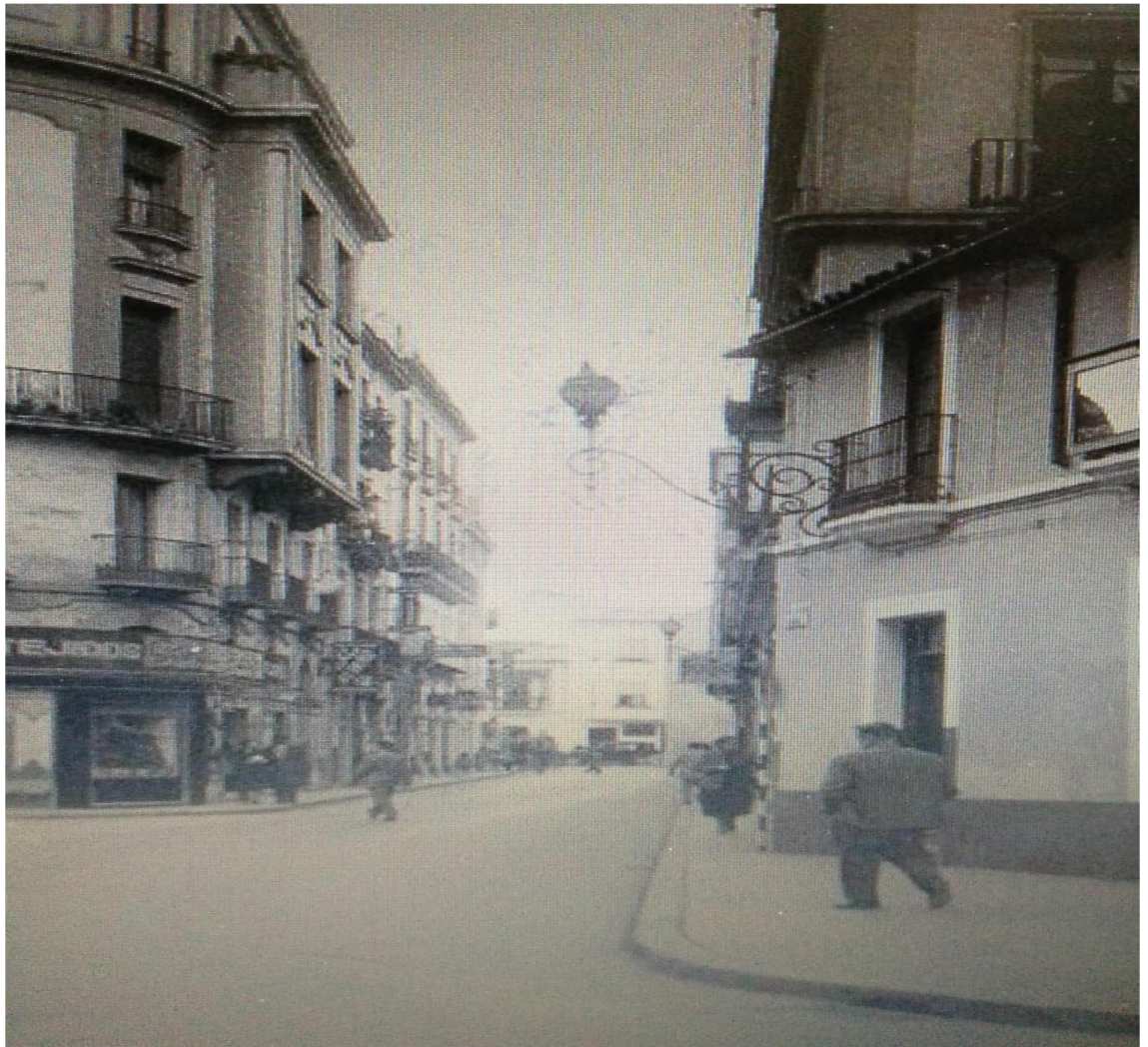
Calle San Álvaro, esquina con Calle Cruz Conde.