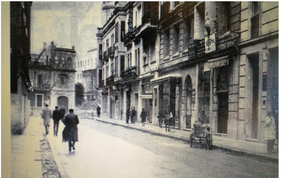
Calle Cruz Conde.